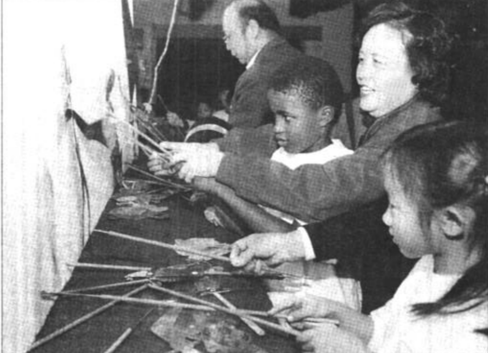
随着中国改革开放的日益深入,越来越多的外籍人士来到中国工作生活。专门为他们子女开设的“洋学堂”也随之前来落地生根。坐落在北京安贞里附近的北京 BISS 国际学校就是这样一所“国际化”的洋学堂。图为学校低年级部的学生在表演皮影戏。

人是从哪里来的?当然已经清晰地展现在人们面前。罗惠麟、陈良忠、胡世学都是云南省地质科学研究所的古生物学家。1997年8月,三人在昆明海口地区的耳村进行田野考察时,意外地发现了两块脊索动物的化石标本。随后,他们对这两块化石开展了长达5年多的研究。他们将这两块化石分别定名为海口华夏鱼和中新鱼。随着研究的深入,3位古生物学家惊喜地发现,这两块不起眼的微小化石竟然隐藏着生命起源的巨大奥秘:海口华夏鱼、中新鱼正是众多科学家百思而不得其解的生物进化过程中两个最大的缺环! (据新华社昆明1月15日电) 今天,罗惠麟、陈良忠、胡世学3位古生物学家向新华社独家披露,他们在昆明地区早寒武世澄江动物群化石中找到重要线索,人类出现以前生物进化过程中非常重要的一些缺环得到了填补,一个寒武纪生命大爆发的壮观图景、一个生命进化的完整链条